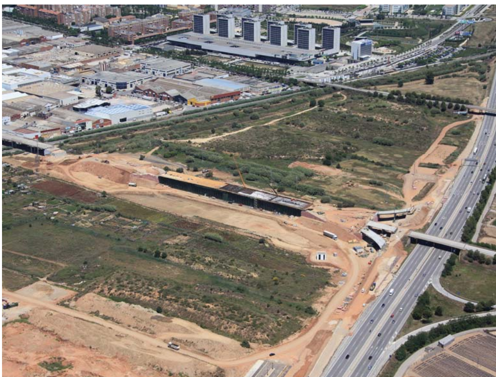
Obres de construcció del viaducte (juny 2014)

El Consorci DeltaBCN, integrat per l'Ajuntament de Viladecans i l'INCASÒL, ha adjudicat la tercera fase de les obres d'urbanització de 42,39 hectàrees (PPU-01) que generaran 16 parcel·les de sòl per activitat econòmica, una de les quals acollirà el Viladecans The Style Oulets .